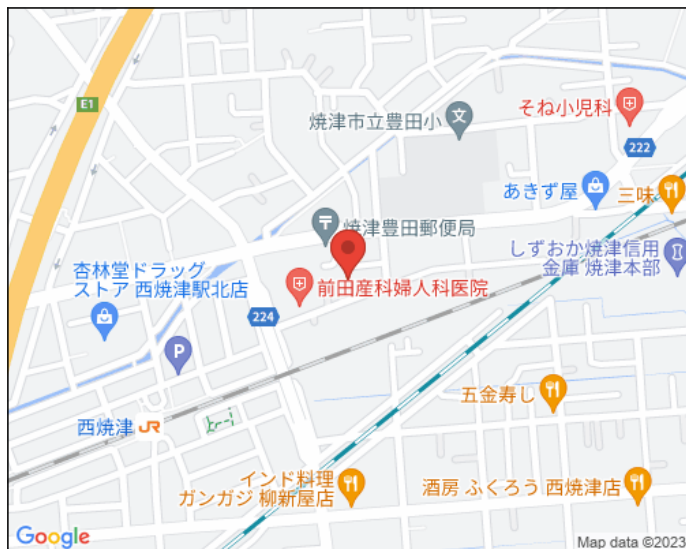
※図面と現況が異なる場合は、現況を優先させていただきます。